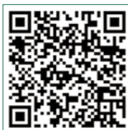
Jelentkezési lap 2.

A jelentkezéshez kérjük ne feledje mindkét jelentkezési lapot megküldeni!