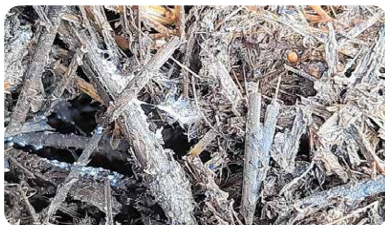
Növényi maradványok irányított bontása javasolt mikrobiális készítménnyel

Ennek köszönhető, hogy a szakértők szerint eljött a biológiai szemléletmód hajnala. Megoldást jelenthet a modern, tudományos alapokon, hosszú évek során kidolgozott, csúcstechnológiával előállított mikrobiológiai készítmények alkalmazása a termőtalajaink védelme érdekében. A világban és Magyarországon is hosszú ideje megfigyelhető a biológiai sokszínűség gyorsuló