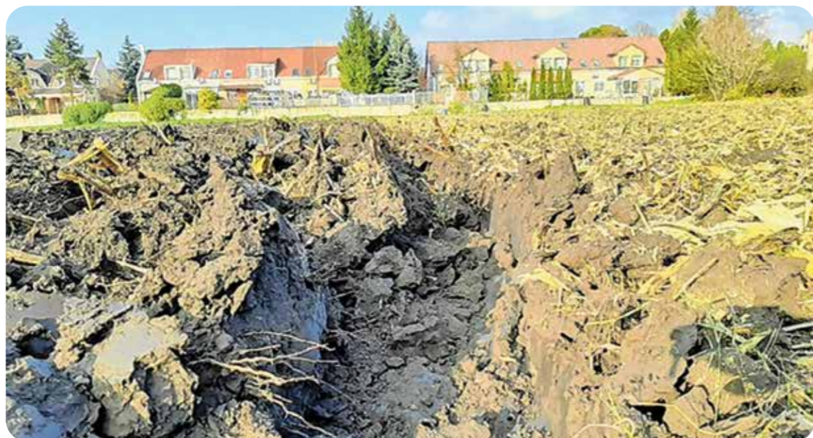
A biológiailag aktív talaj könnyebben művelhető

A harmadik és egyben kiemelkedő tényezőről, a biológiai tulajdonságokról van a legkevesebb tudásunk. Mindenképpen látni kell, hogy az általunk jelenleg közel 100%-on használt termeszto közeg (termőtalaj) a mai mezőgazdasági gyakorlat tekintetében nem fenntartható. Megfelelő lépéseket kell tenni ahhoz, hogy a mérleg nyelve a fenntarthatóság irányába mozduljon el. Látni kell, hogy míg a talaj fizikai és kémiai tulajdonságaira tudunk hatni – úgy-