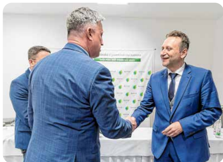
Györfly Balázs, a NAK elnöke és Samuel Vlčan, Szlovákia mezőgazdasági minisztere

lembe a jelenlegi helyzetet – különösen az EU élelmiszerbiztonságának és -szuverenitásának megerősítése tekintetében. Kiemelték, hogy az élelmiszerbiztonság biztosítása rendkívüli stratégiai kérdés és alapvető szemléletváltásra van szükség az agrár-élelmiszeriparról alkotott véleményt illetően Brüsszelben és nemzeti szinten is. A mezőgazdaságnak hozzá kell járulnia az EU környezetvédelmi és éghajlati célkitűzéseikhez, ez azonban nem veszélyeztetheti az élelmiszerbiztonságot, az ágazat versenyképességét és a gazdálkodók jövedelmét, a fenntarthatóság mindhárom pillérét (környezeti, társadalmi, gazdasági) szem előtt kell tartani. Hangsúlyozták, hogy a mostani helyzetben sürgősen át kell gondolni az Európai Zöld Megállapodás célkitűzéseit, és módosítani kell az időzítésüket, különösen azokat, amelyek jelentősen csökkentik az élelmiszer-termelést – így a növényvédőszer és műtrágyák használatának csökkentését, a nem termő, illetve az