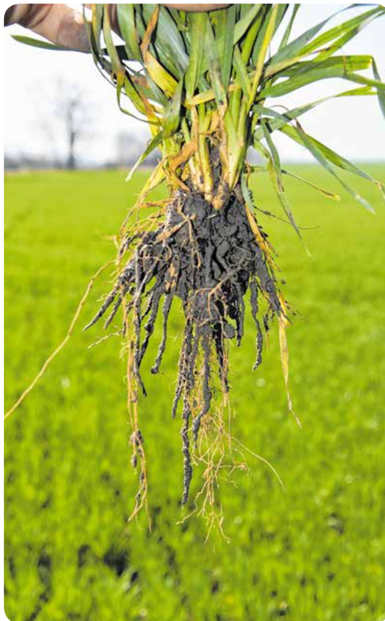
„A gyökérszert körül baktériumokban gazdag talajélet is hozzájárul az aszálytűréshez.”

MAGYAR TALAJBAKTÉRIUM- GYÁRTÓK ÉS -FORGALMAZÓK SZAKMAI SZERVEZETE