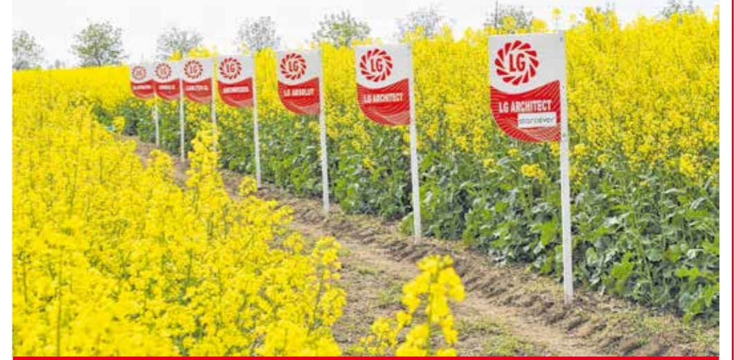
LG bemutató fajtakísérlet

A kettős foma rezisztenciával rendelkező repce hibridek hordozzák az RLM7-rezisztenciát, és ehhez rendelkeznek a széles körű szántóföldi rezisztenciával is. Ezáltal a specifikus védelem és a hatékonyság is biztosított. A foma elleni védekezésben a fungicidek használata – csávázott vetőmag, álmány permetezés – mellett fontos szerepe van az ellenálló hibridek termesztésének, mint: LG ABSOLUT, ARSENAL, ARCHIMEDES.