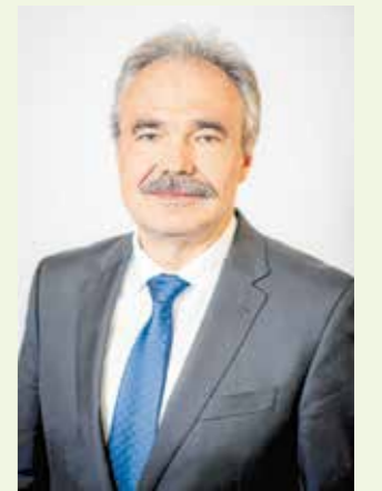
Nagy István miniszter Agrárminisztérium

Nagy várakozással tekintek az idei évre, ugyanis a jövő növekedésének alapjait rakjuk le. Gőzerővel folynak a beruházások, és az őszi, téli időszakban a most épülő üzemek elkezdnek termelni. Emellett már zajlik a 2021-2027-es támogatási időszak tervezése is, amelynek eredményei meghatározóak lesznek az élelmi-szeripar jövője szempontjából. Meggyőződésem, hogy 2019 az építkezés esztendeje az agráriumban és hiszem, hogy a következő évek beruházásai trendfordulót hoznak a magyar mezőgazdaságban.