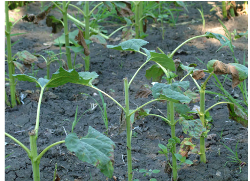
3. kép - Vadkár napraforgó földön

A keresetlevél benyújtása előtt – amennyiben közjegyző előtti előzetes bizonyítási eljárásra nem kerül sor – javasolt a bizonyítási eljárás megalapozása érdekében a kárfelmérésre igazságügyi szakértőt magánszakértőként megbízni, mert a bizonyítandó tényeket a keresetlevél benyújtójának kell rendelkezésre bocsájtania. Ennek szakmailag kellően megalapozott eszköze lehet az igazságügyi szakértői vélemény, ahogy az a közjegyző előtti bizonyítási eljárásban már ismertetésre került.