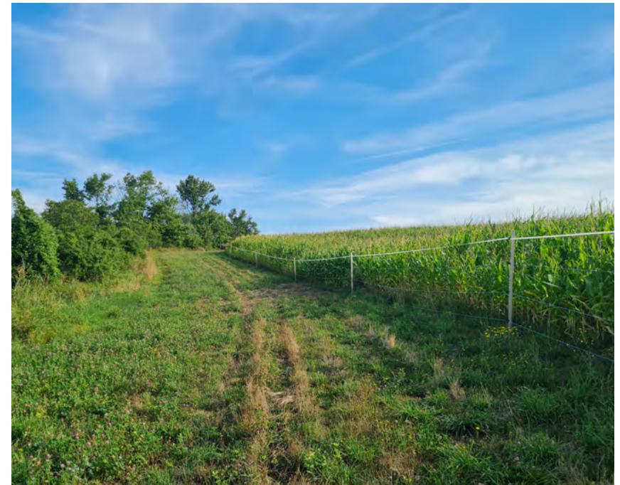
1. kép - Erdő és szántóterület között szabadon hagyott 5 méteres sáv lucerna vetéssel

TIPP: Az erdőszült terület és a mezőgazdasági tábla közötti 5 méter széles sáv nem veszik kárba a gazdálkodó számára, ha pl. a kukoricatábla szélén ebbe sávba lucernát vet, vagy azon AÖP vállalásként zöld parlagot valósít meg.