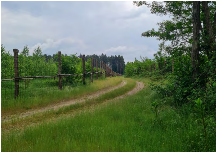
2. kép - Masszív panelkerítéssel védett erdősítés

Ha a jegyző előtti eljárás során az egyezség valamely okból nem jönne létre, a jegyző megszünteti az eljárást.