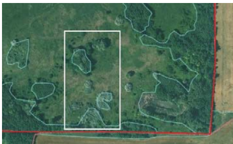
A támogatásba bevinni kívánt KET határvonalai

A KET kimérése során nem lehet figyelembe venni az adott kötelezettségvállalással érintett egybefüggő területen elhelyezkedő, a MePAR-ban nem támogatható területként megjelölt területeket (tanyák, állattartó épületek, telepek, bozotos területek, tájképi elemként le nem határolt facsoportok, amelyek alatt művelést nem folytatnak, utak stb.). Ez alól a nád tematikus előírascsoport jelent kivételt, valamint azon nem támogatható területek, amelyek vonatkozásában a 2024. évi egységes kérelem keretében változás vezetési bejelentés történt és a változás vezetési bejelentés a támogatási kérelem benyújtásáig nem került még lezárásra.