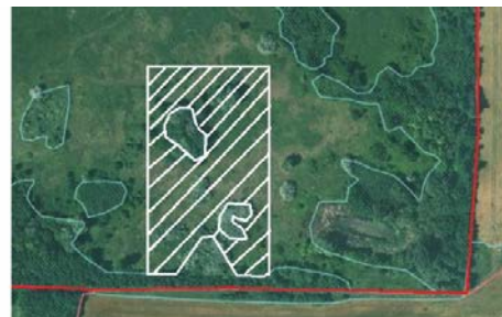
A KET kimérhető területe