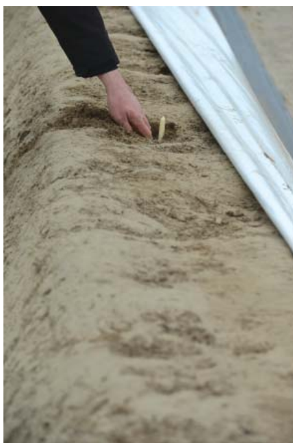
Az etikai szabályok egyik célja: az illegális szereplők kiszorítása a piacról.

I Attól nem lehet tartani, hogy a szabályokat az utolsó sorig betartók fognak rosszul járni, azaz a tilosban járóknak majd nagyobb lehet a piaca?