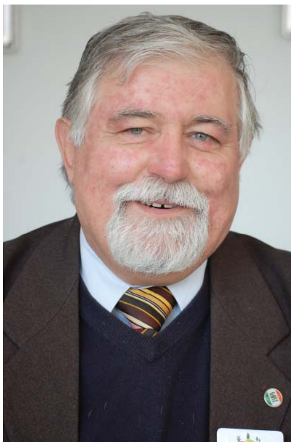
Cél: közepesnél jobb termésnél is legyen elfogadható a felvásárlási ár.