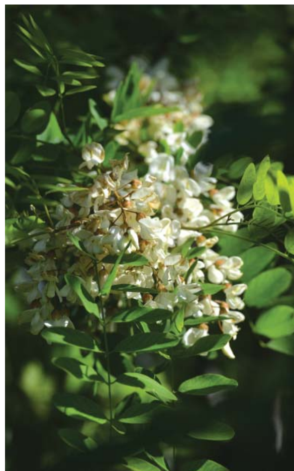
Az idén ritka gazdagságú akácvirágzás volt országszerte

De vajon ki és miért akarja e kiváló növényt bármiben is korlátozni? A kérdést szinte mindenki feltette idehaza, miután híre ment, hogy az Európai Bizottság, mint nem őshonos fafajtát indexre akarja tenni a fehér akácot. A környezetvédő szakértők ugyanis „felfedezték”, hogy a mintegy háromszáz éve betelepített fehér virágú fa mérgező vegyületeket juttat a talajba ezzel, a bodzát és csalánt kivéve, minden aljnövényzetet tönkre tesz. Akárcsak a fenyő az Alpokban – bár azzal