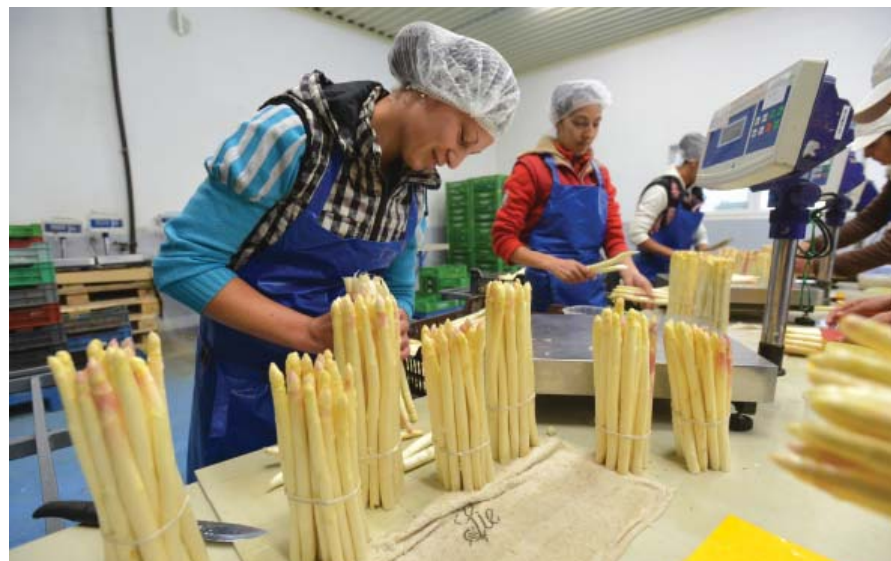
Az előrecsomagolt spárgáért többet fizetnek a külföldi vevők. Hitellel elérhetőbb a csomagológép.

Ugyanakkor az agrárosok rendszeresen fizették tartozásaikat, törlesztették hiteleiket. Ez mondjuk igaz volt az elmúlt hús esztendőben is, például az AVHGA által kezelt