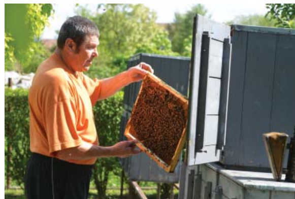
Lehet, hogy furcsán hangzik, de a méhészkedés is állattenyésztés. Ezt az ágazatot a bankok is kiemelt figyelemmel kísérik.

Mint az írás elején már említettük, a támogatások egy része szinte automatikusan érkezik évről évre a termelők számlájára. Nos, erre alapozva hoztak létre a pénzintézetek egy sor terméket, például erre épül a támogatást előfinanszírozó hitel, vagy éppen a faktoring. A kettő között az a különbség, hogy a hitelnél a támogatás mértékéig a bankok kamattal terhelt hitelt adnak, míg a faktorálással foglalkozó cég végeredményben megveszi az adott támogatási jogosultságot a gazdálkodótól, s a faktorcég igényli majd adott időben ezt az összeget a kifizető ügynökségtől (MVH), de a gazdálkodónak már előre kifizeti a támogatás némileg csökkentett összegét. Ez a különbség igazából a faktoring cég használatára, ugyanakkor a gazdálkodónak nem kell például év végéig várnia, hogy megkaphassa a területalapú támogatás összegét. Ez jól jön mondjuk egy beruházás finanszírozásánál, vagy ha pénzügyi gondja van a gazdálkodónak. Így nem kell hitelt felvennie, végeredményben egyszeri ügylet során korábban jut – némileg megkurtított – támogatásához.